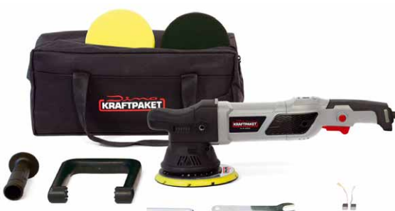
Die Dino Kraftpaket Exzenter-Poliermaschine kommt in einer Tasche mit zwei Polierpads und Bedienwerkzeug