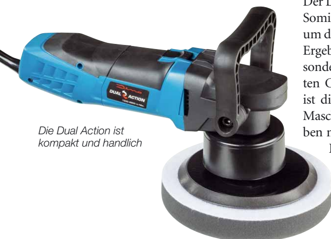
Die Dual Action ist kompakt und handlich