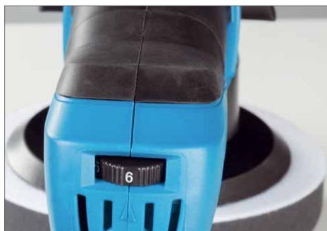
Die Schwingzahl lässt sich stufenlos zwischen 1500 und 6800 1/min regeln

Die Maschine ist mit einem Gewicht von knapp 2,5 kg und recht kompakten Abmessungen leicht zu handhaben. Um unterschiedlichste Materialien bearbeiten zu können, verfügt die Maschine über eine elektronische Drehzahlregelung. Die Polierschwämme werden per Klett befestigt. Für genügend Reichweite sorgt ein 5 m langes Zuleitungskabel. Im Lieferumfang befinden sich zwei unterschiedlich harte Polierscheiben sowie das Werkzeug zum Wechsel des Poliertellers. Außerdem gehört eine stabile Transporttasche zum Gerät.