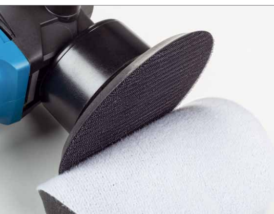
Die Polierscheiben werden per Klettverbindung befestigt